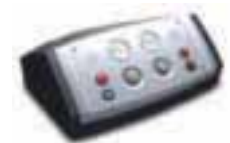
TBOX Basic 1011-105 et 106